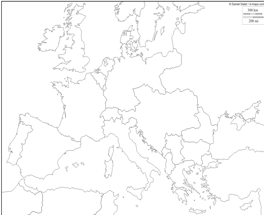
Európa 1914 kezdetén. A 2. feladathoz kapcsolódó térkép