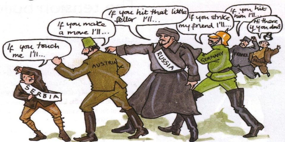
A modern redrawing of an American cartoon published in the Brooklyn Eagle , July 1914. The cartoon was called 'The Chain of Friendship'.

A rajz és ismereteid alapján próbált összefoglalni hogyan vezetett Ausztria-Magyarország ellentéte Szerbiával világháborúhoz!